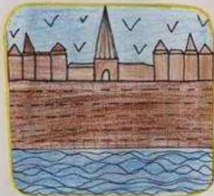
Les murs et ses remparts