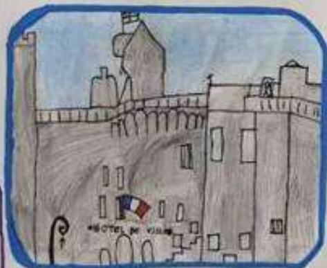
L'hôtel de ville