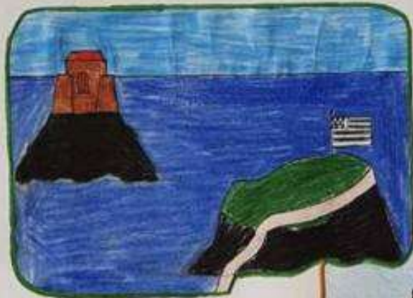
Le Grand Bé et le Île National