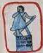
Pêcheurs et explorateurs Malouins